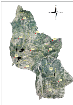
MAPA ESTACIONES DE MUESTREO (EM)